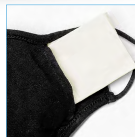
Einschubmöglichkeit für einen Filter / Tuch 1